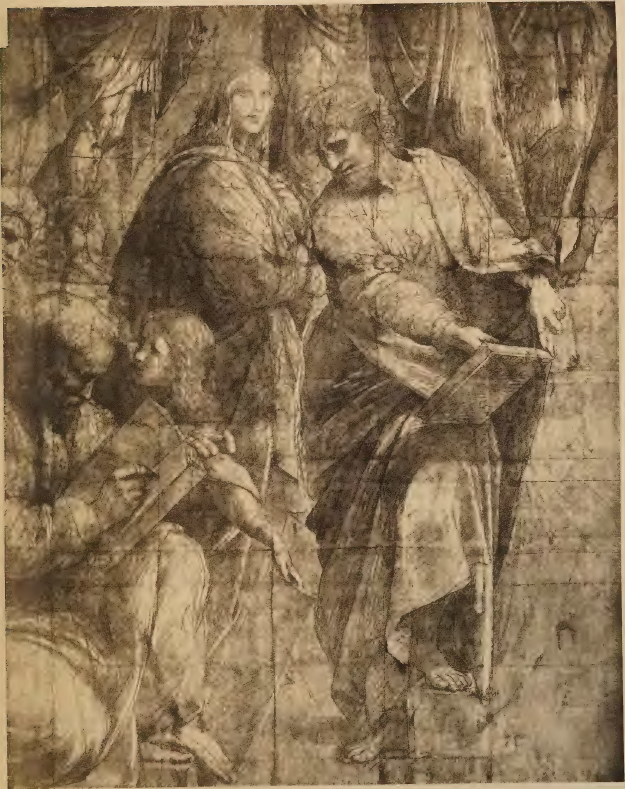
Etude pour l'Ecole d'Athènes (à l'Ambrosiana)